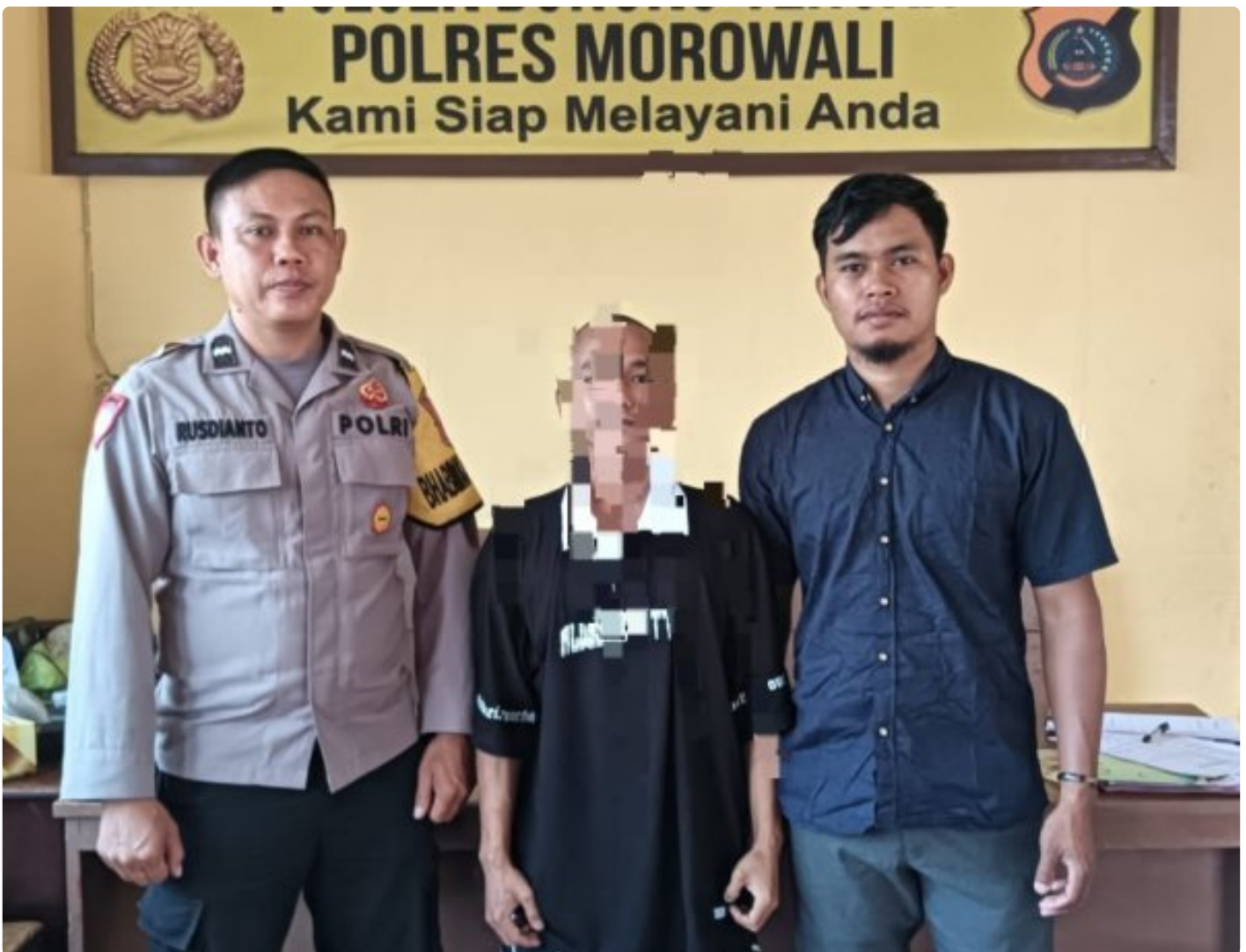
Aparat Polsek Bungku Tengah Berhasil Tangkap Pelaku Curanmor

MOROWALI, Sulawesi Tengah- Pada Hari Sabtu 5 Oktober 2024 Sekitar Pukul 18.30 Wita Kepolisian Sektor (Polsek) Bungku Tengah Polres Morowali, berhasil mengungkap kasus pencurian kendaraan bermotor (curanmor) yang terjadi di Kelurahan Marsaoleh, Kecamatan Bungku Tengah, Kabupaten Morowali,