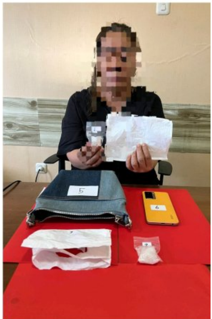
Tampak 2 wanita di tangkap Satreskoba Polres Morowali

MOROWALI, Sulawesi Tengah- Satuan Reserse Narkoba Polres Morowali Polda Sulteng, berhasil mengungkap kasus penyalahgunaan narkotika jenis sabu di Desa Topogaro, Kecamatan Bungku Barat, Kabupaten Morowali Propinsi Sulawesi Tengah (Sulteng), Dalam penggerebekan yang dilakukan pada Minggu